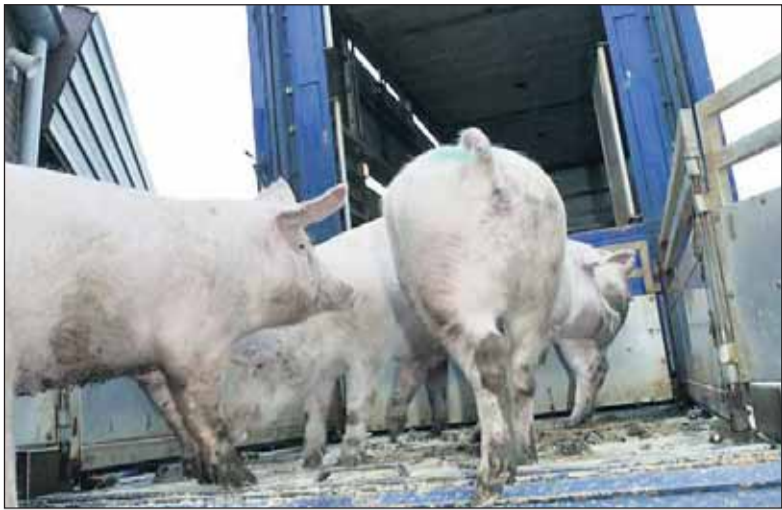
Veevervoer moet strengere controles krijgen, vindt Eyes on animals.