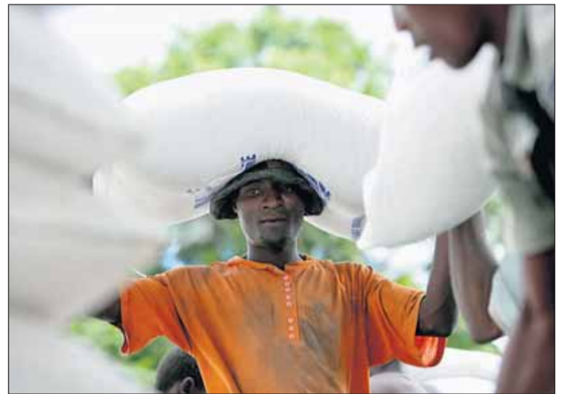
Voedselhulp in Oost-Zimbabwe.